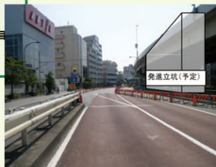
発進立坑予定位置